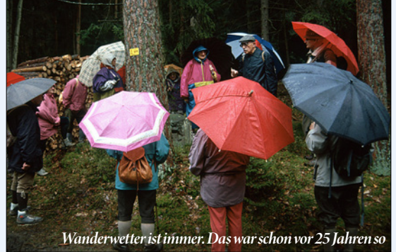
Wanderwetter ist immer. Das war schon vor 25 Jahren so