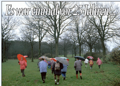
Es war einmal vor 25 Jahren...