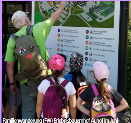
Familienwanderung (FW) Erlebnisbauernhof Auhof im Juni