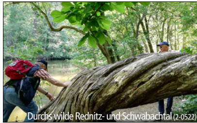
Durchs wilde Rednitz- und Schwabachtal (2-0522)