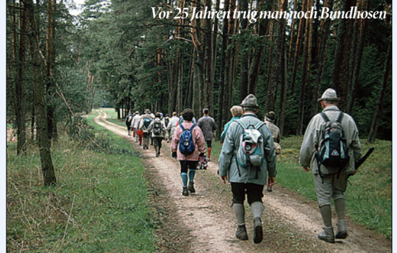
Vor 25 Jahren trug man noch Bundhosen