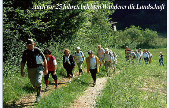
Auch vor 25 Jahren belebten Wanderer die Landschaft