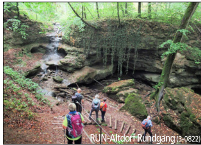
RUN-Altendorf Rundgang (3-0822)