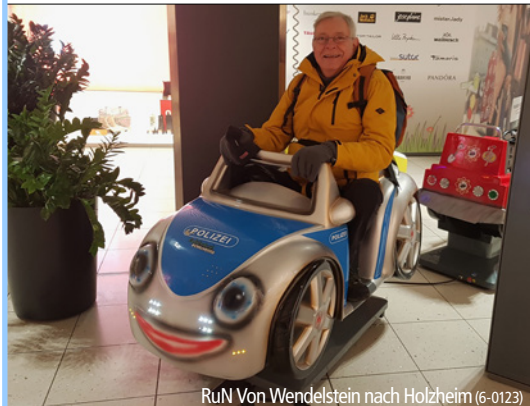
RuN Von Wendelstein nach Holzheim (6-0123)