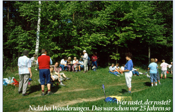
Wer rastet, der rostet? Nicht bei Wanderungen. Das war schon vor 25 Jahren so