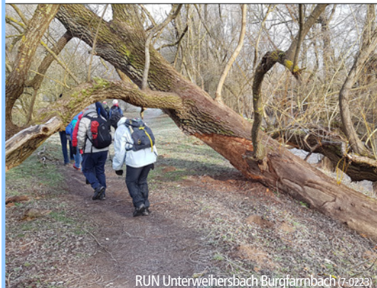
RUN Unterweihersbach Burgfarnbach (7-0223)