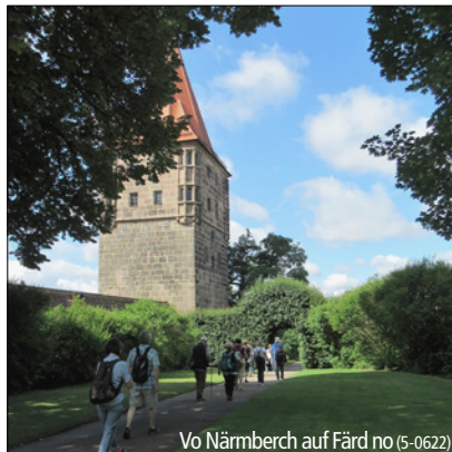
Vo Nürnberg auf Färd no (5-0622)

Fotografen (1-0523) Eva Obernd, Hildegard Weiß (2-0523) Klaus Schäffler (3-0822) Hildegard Weiß (4-0922) Jutta Frosch (5-0822) Hildegard Weiß (6-0123) Hildegard Weiß (7-0223) Patricia Jousse, Heike Fölsch, Hildegard Weiß