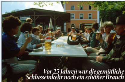
Vor 25 Jahren war die gemütliche Schlusseinkehr noch ein schöner Brauch