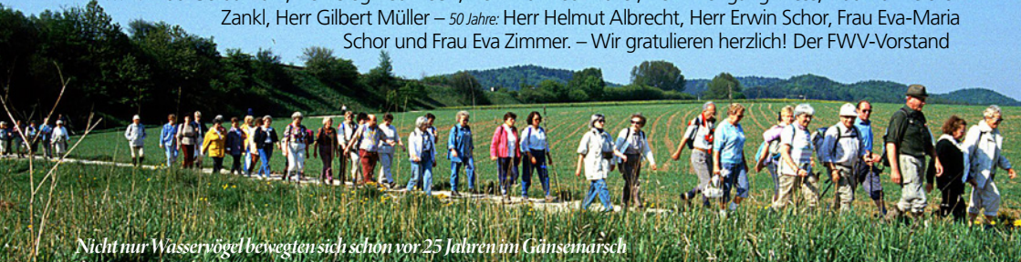
Nicht nur Wasservögel bewegten sich schön vor 25 Jahren im Gänsemarsch